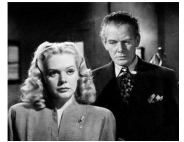
1945 CRIME PASSIONNEL (Fallen Angel) d'Otto Preminger avec Alice Faye