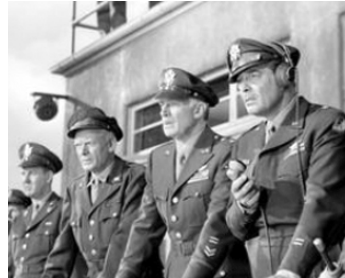
1948 TRAGIQUE DÉCISION (Command Decision) de Sam Wood avec W. Pidgeon, Clark Gable