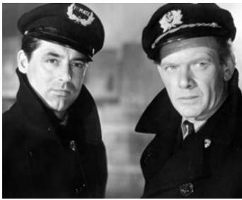
1943 MISTER LUCKY (Mister Lucky) d'H. C. Potter avec Cary Grant