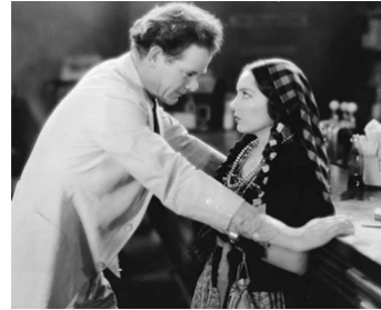
1931 L'INDIENNE (The Squaw Man) de Cecil B. De Mille avec Lupe Velez