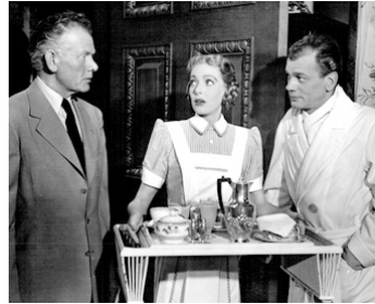
1947 MA FEMME EST UN GRAND HOMME (The Farmer's Daughter) d'H.C. Potter avec Loretta Young, J. Cotten