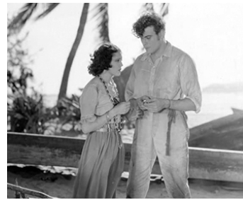
1929 LE DÉMON DE LA MER (The Sea Bat) de Wesley Ruggles avec Raquel Torres