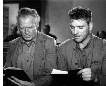
1947 LES DÉMONS DE LA LIBERTÉ (Brute Force) de Jules Dassin avec Burt Lancaster