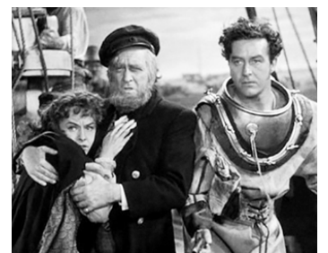
1941 LES NAUFRAGEURS DES MERS DU SUD de Cecil B. De Mille avec P. Goddard, R. Milland