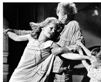
1962 LE JOUR DU VIN ET DES ROSES (Days of Wine and Roses) de B. Edwards avec Lee Remick