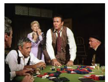
1966 GROS COUP À DODGE CITY (Big Deal...) de Fielder Cook avec J. Robards, Henry Fonda