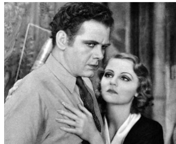
1932 LA FOUDRE D'EN BAS (Thunder Below) de Richard Wallace avec Tallulah Bankhead