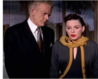
1954 UNE ÉTOILE EST NÉE (A Star is born) de George Cukor avec Judy Garland