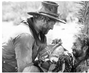
1929 LES HÉROS DE L'ENFER (Hell's Heroes) de William Wyler avec Robert Hatton