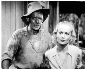
1933 LE FOU DES ÎLES (White Woman) de Stuart Walker avec Carole Lombard