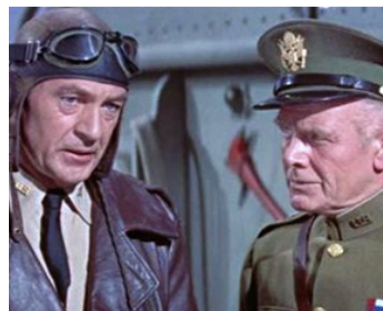
1955 CONDAMNÉ AU SILENCE (The Court Martial of Billy Mitchell) d'O. Preminger avec G. Cooper