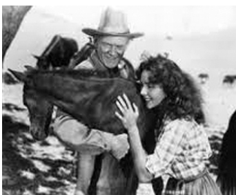
1937 LA FURIE DE L'OR NOIR (High, wide and handsome) de R. Mamoulian avec D. Lamour