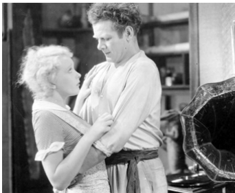
1931 LA DANSEUSE DE PANAMA (Panama Flo) de Ralph Murphy avec Helen Twelvetrees