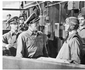
1944 PORTE-AVIONS X (Wing and a Prayer) d'H. Hathaway avec Don Ameche, Dana Andrews