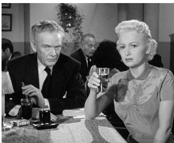
1955 POUR QUE VIVENT LES HOMMES (Not as a Stranger) de S. Kramer avec O. De Havilland