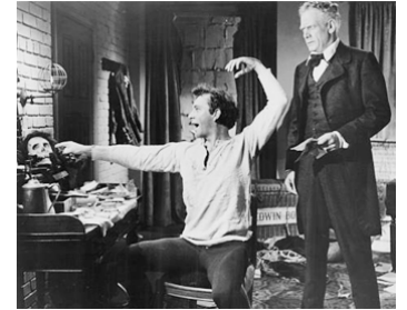
1954 LE PRINCE DES ACTEURS (Prince of Players) de Phillip Dunne avec Richard Burton