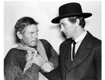
1936 UNE AVENTURE DE BUFFALO BILL (The Plainsman) de Cecil B. DeMille avec G. Cooper