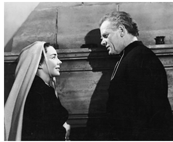
1943 LE CHANT DE BERNADETTE (The Song of Bernadette) d'Henry King avec Jennifer Jones