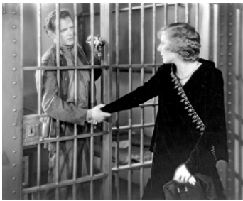
1929 DYNAMITE (Dynamite) de Cecil B. DeMille avec Kay Johnson