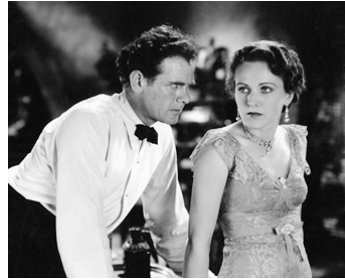
1931 VOLUPTÉ SOUS LES TROPIQUES (East of Borneo) de George Melford avec Rose Hobart