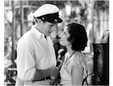
1931 THE PAGAN LADY de John Francis Dillon avec Evelyn Brent