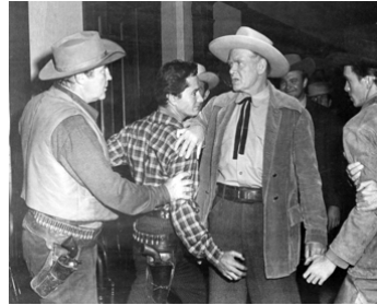
1953 LA DERNIÈRE CHEVAUCHÉE (The last Posse) d'A. Werker avec Broderick Crawford, J. Derek