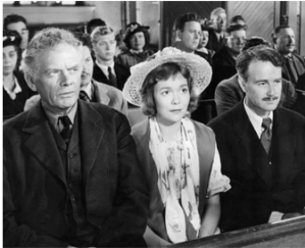
1948 JOHNNY BELINDA (Johnny Belinda) de Jean Negulesco avec Jane Wyman, Lew Ayres