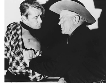
1950 MARQUÉ AU FER (Branded) de Rudolph Maté avec Alan Ladd