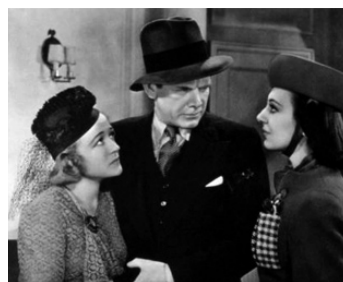
1938 LA LOI DE LA PÈGRE (Gangs of New York) de J. Cruze avec Wynne Gibson, Ann Dvorak