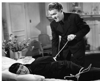
1937 LA FILLE DE SHANGHAÏ (Daughter of Shanghai) de R. Florey avec Anna May Wong