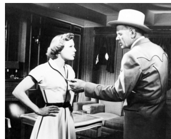
1956 L'EXTRAVAGANTE HÉRITIÈRE (You can't run away from it) de D. Powell avec June Allyson