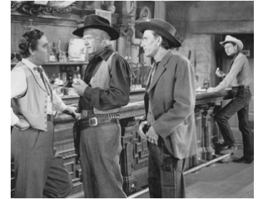
1948 3000 $ MORT OU VIF (Four Faces West) d'Alfred E. Green avec J. Calleia, Joel McCrea