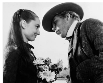
1959 LE VENT DE LA PLAINE (The Unforgiven) de John Huston avec Audrey Hepburn