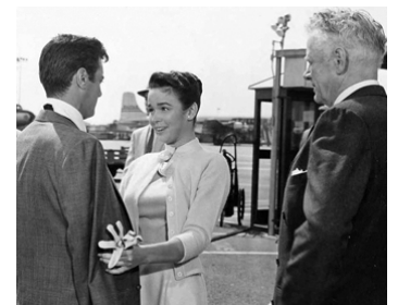
1957 L'EXTRAVAGANT M. CORY (Mister Cory) de B. Edwards avec Tony Curtis, Kathryn Grant