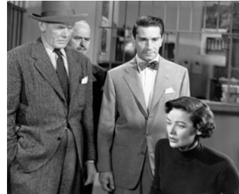
1949 LE MYSTÉRIEUX DR KORVO (Whirlpool) d'O. Preminger avec R. Conte, Gene Tierney