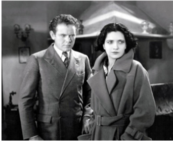
1930 FLEUR DE LA PASSION (Passion Flower) de William C. DeMille avec Kay Francis