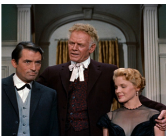
1958 LES GRANDS ESPACES (The big Country) de William Wyler avec G. Peck, Carroll Baker