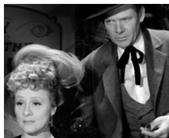
1940 LA REINE DU YUKON (Queen of the Yukon) de Phil Rosen avec Irene Rich