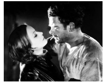
1930 ANNA CHRISTIE (Anna Christie) de Clarence Brown avec Greta Garbo