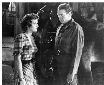
1939 DES SOURIS ET DES HOMMES (Of Mice and Men) de L. Milestone avec Betty Field