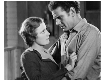
1932 SA FEMME (No Other Woman) de J. Walter Ruben avec Irene Dunne