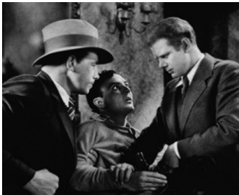
1933 LA LOI DU LYNCH (This Day and Age) de Cecil B. DeMille avec Bradley Page